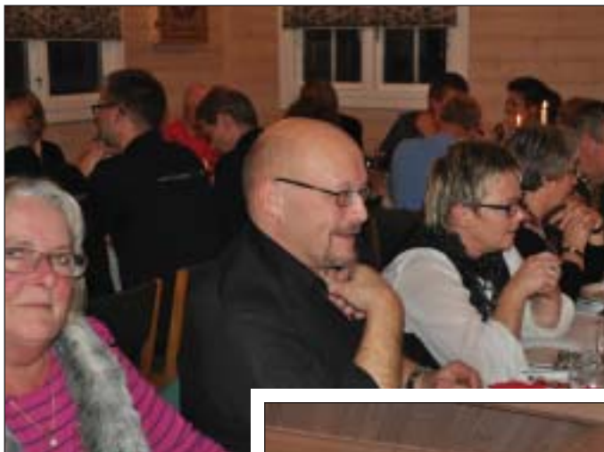
Frank ser frem til!