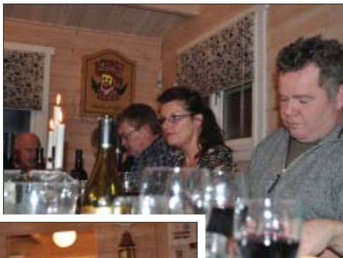
Christian konsentrere sig om emnet