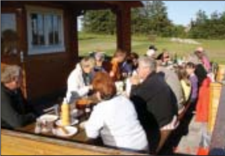
Der hygges ved bordet.