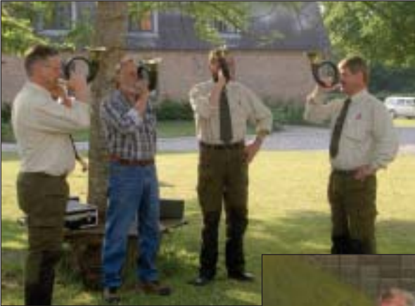
Morgenparole med maner, tak for det i brave blæsere.